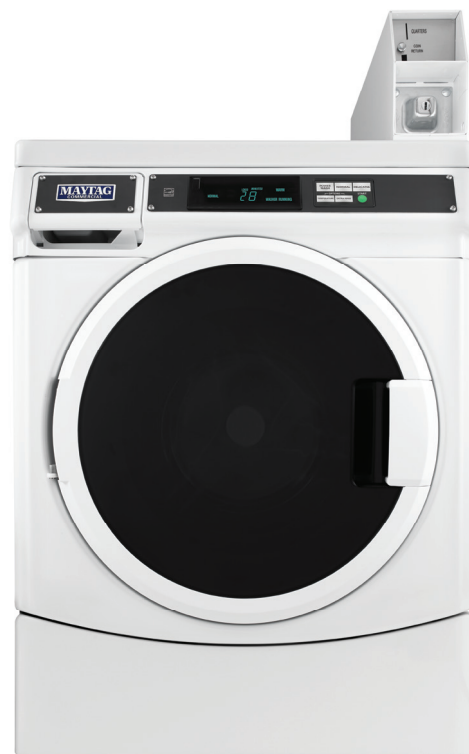
МОНЕТНАЯ MHN33PDCGW (НА КАРТИНКЕ)