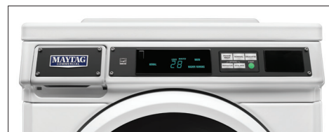
ДЕБИТОВАЯ & БЕСПЛАТНАЯ MHN33PNCGW (НА КАРТИНКЕ)